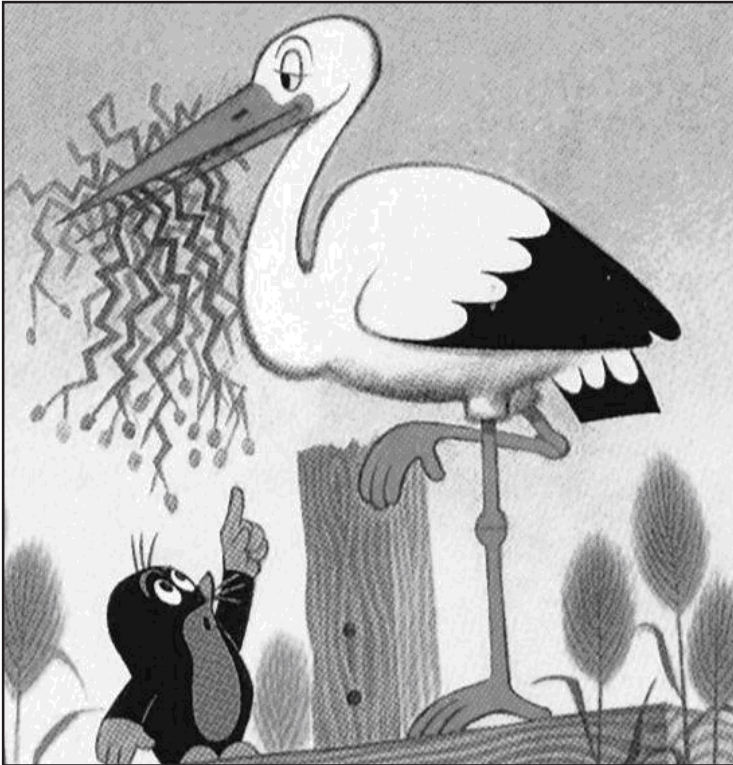
A telhetetlen gólya

Volt a világon egy gólya, hosszú volta cső re. Sétált, sétált a tó partján, egész nap a hasát tömte. Annyi kígyót ehetett, amennyi csak belefért. Mégsem volt elég neki. Egyszer azt gondolta: